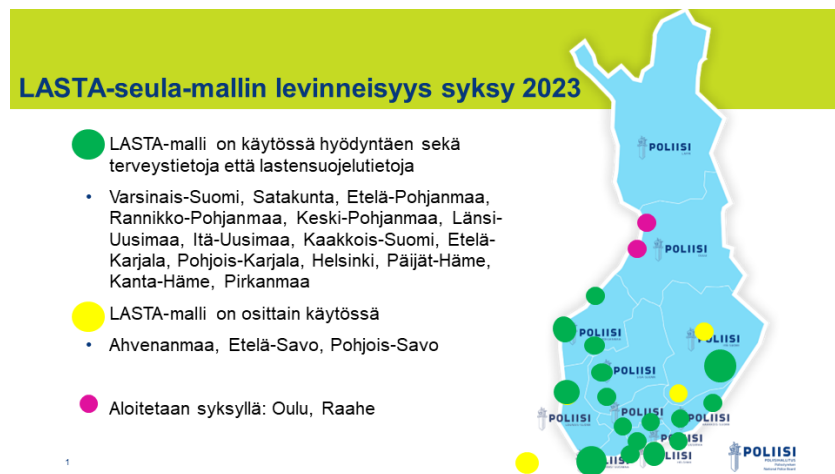
Kuva 2. LASTA-seula-mallin levinneisyys 2023

Lapsiin kohdistuneiden rikosten tutkinnassa moniammatilliset esiselvittelymallit mahdollistavat tapauksen kokonaisvaltaisen tarkastelun, jossa tulee huomioiduksi rikosvastuun tehokkaan toteutumisen ohella myös lapsen etu. Esitutkintayhteistyö, moniammatillinen yhteistyö sekä tutkinnanjohtajien ja tutkijoiden ja syyttäjien yhteiset koulutukset ja kokoontumiset vaikuttavat esitutkinnan ja tehtävän esitutkintayhteistyön laatuun ja tehokkuuteen, mitkä puolestaan edistävät rikosprosessin joutuisuutta.